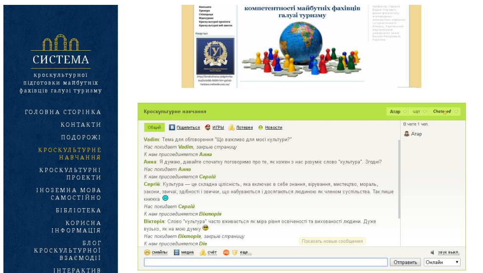
Рис. 1. Модерація в чаті

Наведемо приклад застосування методу модерації на тему «Що важливо для моєї культури?». Метою теми для обговорення є виявлення певних особливостей культури як середовища виховання; допомога студентам знайти подібності та відмінності представлених культур. Студентам (їх кількість – будь-яка, але оптимальна – до 25 осіб) було запропоновано обговорити поняття культури в контексті кроскультурної освіти. Технічним засобом для обговорення можна обрати чат, наприклад, http://cross-cultural.chatovod.ru/ (рис. 1).