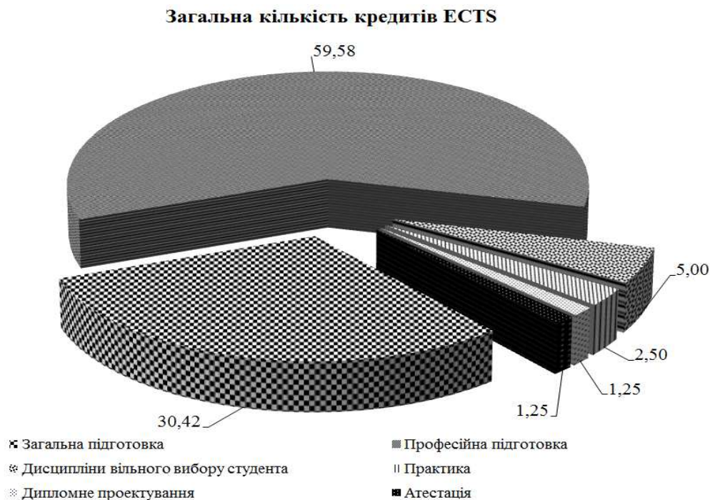
Рис. 2 Зміст навчального плану підготовки бакалавра за спеціальністю «Галузеве машинобудування»

Як підкреслює С. Резнік, «сучасні підходи до поняття освіченості й професіоналізму висувають також вимоги до фундаменталізації вищої технічної освіти. Фундаменталізація освіти передбачає спрямованість на засвоєння універсальних закономірностей, що лежать в основі будь-якої сфери наукового знання... Така підготовка дає фахівцеві можливість свободи творчості у своїй сфері діяльності, забезпечує необхідну гнучкість прийняття рішень, збільшує потенційну кількість таких рішень. На відміну від вишкеспеціалізованого знання, що швидко застаріває, фундаментальна підготовка забезпечує необхідну міцність, обґрунтованість і затребуваність навчальної інформації. У процесі навчання студент має, в першу чергу, засвоїти фундаментальну складову змісту освіти, оскільки така підготовка є основою для вивчення всіх інших предметів, для формування цілісного, системного розуміння навколишнього світу» [8, с. 17].