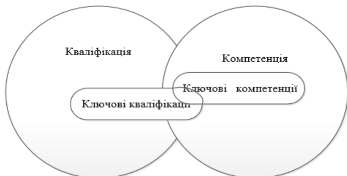
Рис. 1. Співвідношення понять «кваліфікація» та «компетенція» в теорії педагогіки

Кваліфікаційні вимоги до майбутнього лікаря регламентуються законодавчими документами. Такими документами є «Лікарська директива» Європейського союзу [11, Р. 481 – 482], Рекомендаціями Європейського Парламенту та Ради ЄС «Про основні компетенції для навчання протягом усього життя» та ін.