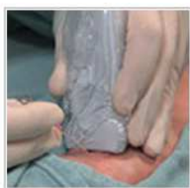
VIDEOS IN CLINICAL MEDICINE Ultrasound-Guided Insertion of a Radial Arterial Catheter October 9, 2014 | Ailon J. Mourad O. Chien V. Saun T. Dev S.P. | N Engl J Med 2014; 371:e21

Реалізація першої педагогічної умови відбувається шляхом розвитку професійно-пізнавального інтересу студентів у процесі навчання за рахунок урізноманітнення навчальної діяльності, залучення майбутніх лікарів до самостійної дослідницької діяльності (самостійна робота, індивідуальна робота). Друга педагогічна умова, на нашу думку, ефективно реалізується під час розв'язання компетентнісних задач із поступовим ускладненням. Щодо третьої педагогічної умови вважаємо ефективними засобами навчання, крім підручників, посібників, приладів, демонстраційних матеріалів, є інтерактивні засоби, що представлені мультимедійними зображеннями, відео. Такі засоби дозволяють проілюструвати процес використання фізичного явища у медицині на конкретному прикладі клінічної практики. Зазвичай подібні ресурси розміщені у відкритому доступі (рис. 3) [13]. Часткове застосування мультимедіа є виправданим для пояснення принципів застосування фізичних явищ у медичній практиці, зокрема, методи фонокардіографії, сонографії, ультразвукової діагностики, аускультатії, перкусії, літострикіції, клінічного методу вимірювання артеріального тиску та ін. Навчальний матеріал у сервісі структурований таким чином, що поступово перед здобувачами постають: короткий огляд проблеми, що досліджується, викладку матеріалу з анатомії, історію хвороби пацієнта, результати досліджень, постановка діагнозу.