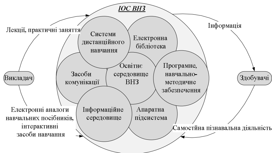
Рис. 4. Модель інформаційного освітнього середовища вищого медичного навчального закладу

Окрему увагу формуванню перелічених складових слід приділяти, на нашу думку, на третьому освітньо-науковому рівні вищої освіти, що характеризується, у свою чергу, поєднанням освітньої та науково-дослідної робіт у процесі підготовки. Наукова робота на даному етапі є предметом діяльності і вимагає нових підходів до її організації. Так, важливо ознайомити здобувачів освіти з основами роботи з Google Scholar, міжнародною мультидисциплінарною реферативною платформою Web of Science, програмою Mendeley, базою GenBank, світовим архівом послідовностей нуклеїнових кислот Protein Data Bank, електронно-пошуковою системою PubMed, базою даних медичної інформації MEDLINE та ін. Потреба у використанні вищевказаних ресурсів зумовлена необхідністю пошуку інформації для підготовки до практичних занять, роботи над індивідуальними завданнями. Усвідомлення важливості застосування даних ресурсів у навчанні трансформується у стійку мотивацію, а потім – і на переконання через використання їх для власного наукового пошуку.