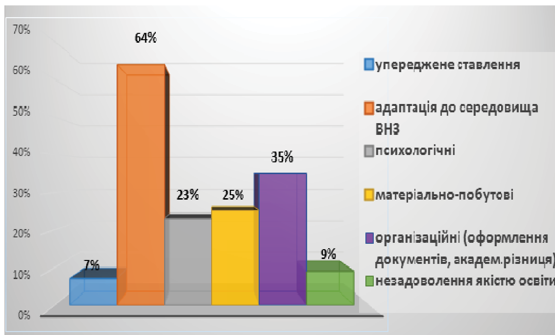
Рис. 2 Труднощі студентів-переселенців, з якими вони стикалися під час переведення до нового ВНЗ

колективі, через непорозуміння з одногрупниками та викладачами, через низький рівень навчальних досягнень тощо. Існують проблеми незнання чи нерозуміння навчальних та організаційних вимог, проблеми включення у колектив, спілкування.