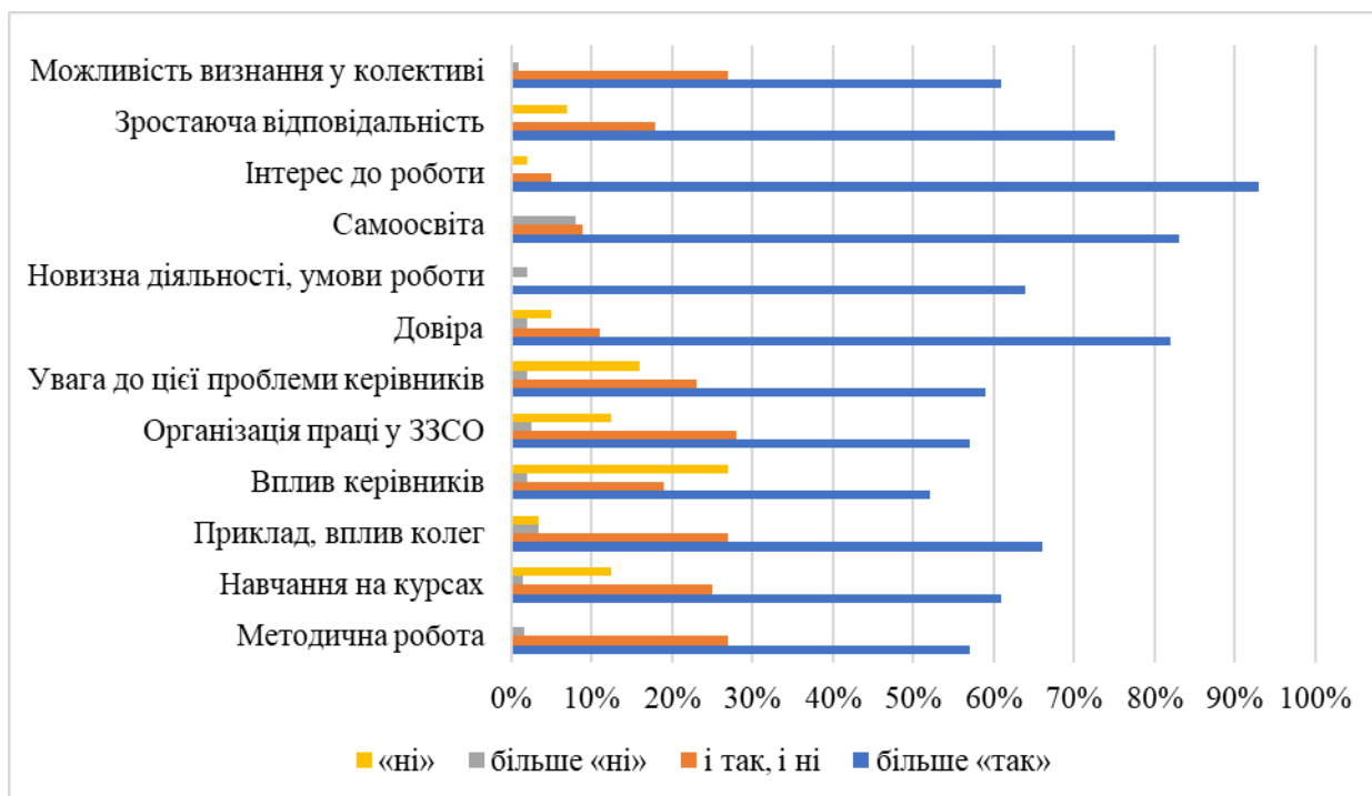
Рис. 3.7. Динаміка результатів анкетування по виявленню чинників, що стимулюють саморозвиток педагогічного колективу ЗЗСО

Подальша діагностика підтвердила, що в ході експерименту стали покращуватися показники ефективності управління школою та якість освіти в цілому. Наприклад, повторне анкетування за методикою Т. Морозової (Морозова, 2001, С. 72.). «Оцінка задоволеності роботою» показало, що колектив в середньому задоволений основними результатами своєї праці, максимально задоволений роботою адміністрації, можливістю реалізувати свої здібності, будувати стосунки з керівниками (4,4 балів за 5-бальною шкалою); 81 % педагогів (на початку експерименту таких було лише 45 %) відмітили позитивні зрушення планування організаційно-педагогічної діяльності в ЗЗСО у вирішенні питань комунікативної взаємодії керівника і педагогів. Динаміка рівнів задоволеності персоналу ЕГ і КГ ЗЗСО власною діяльністю у процесі експерименту (зміна процентного співвідношення співробітників, що позитивно оцінюють діяльність управлінської команди і характер змін, що проводяться в ЗЗСО) представлена на рис. 3.8.