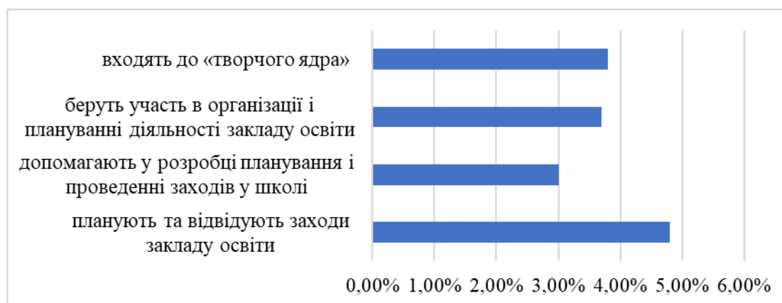
Рис. 3.5. Активність педагогічного колективу щодо участі у організаційно-педагогічній діяльності в ЗЗСО

Методи опитування щодо активності респондентів у плануванні організаційно-педагогічній діяльності в ЗЗСО дозволили виявити наступне: планують та відвідують заходи закладу освіти – 4,8 %; допомагають у розробці планування і проведенні заходів у школі – 3,0%; беруть участь в організації і плануванні діяльності закладу освіти – 3,7 %; входять до «творчого ядра» (є безпосередніми організаторами заходів в школі) – 3,8 % (рис. 3.5).