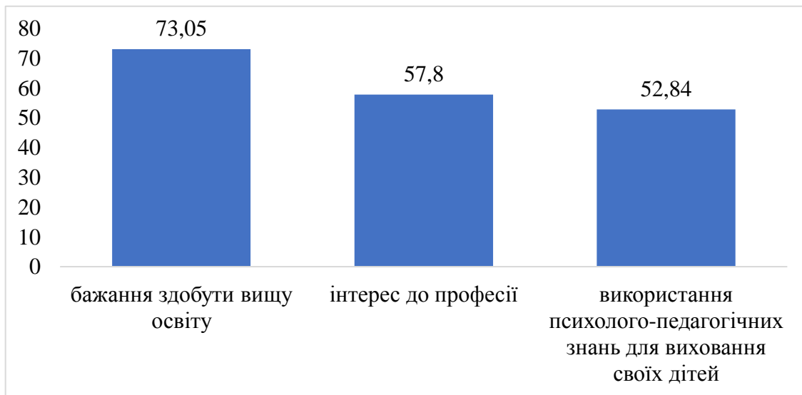
Рис. 1. Головні мотиви, які сприяють вибору спеціальності у майбутніх психологів

Аналізуючи результати за окремими характеристиками мотивів, ми отримали, що головними мотивами, які сприяють вибору даної спеціальності, є: на першому місці – 73,05% (206 осіб) – бажання здобути вищу освіту, на другому – 57,8% (163 особи) - інтерес до професії, на третьому – 52,84% (149 осіб) – використання психолого-педагогічних знань для виховання своїх дітей. Графічно динаміка результатів мотивації щодо вибору професії у майбутніх психологів відображені на рис. 1.