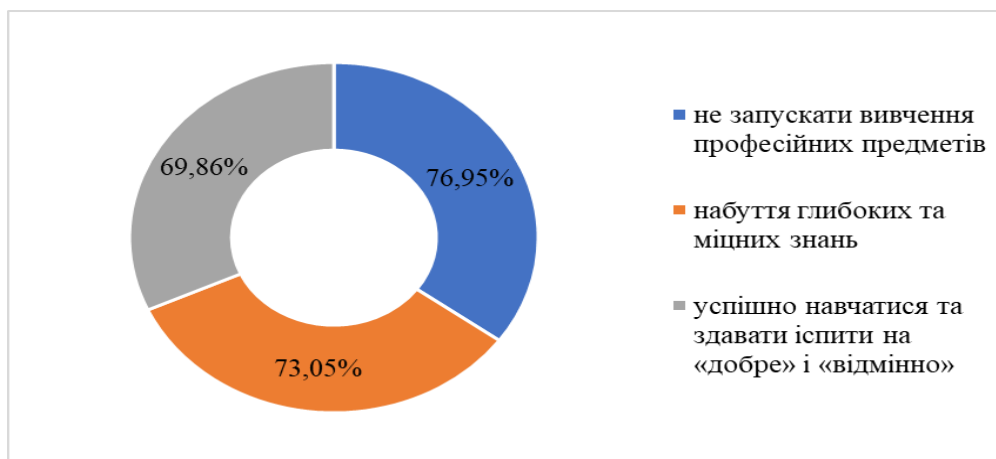
Рис. 2 Найбільш значущі мотиви для майбутніх психологів у навчанні

Аналіз результатів, отриманих за методикою «Вивчення мотивів освітньої діяльності здобувачів освіти» (А. Реан, В. Якунін) графічно зображено на рис.3.