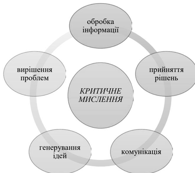
Рис. 1. Сфери застосування критичного мислення

Під критичним мисленням будемо розуміти такий спосіб мислення, у процесі якого людина, насамперед, ставить під сумнів інформацію, що до неї надходить, і намагається самостійно з'ясувати її істинність, аргументуючи свою позицію. Критичне мислення відрізняється обґрунтованістю, цілеспрямованістю і контролем. Воно інтегроване в кожний інший вид мислення, впливає на їх логіку, якість, цілісність, взаємозв'язок. Критичне мислення не виникає автоматично як побічний результат навчання, потрібно систематично працювати над його удосконаленням, зокрема, враховуючи такі ключові сфери застосування (рис. 1).