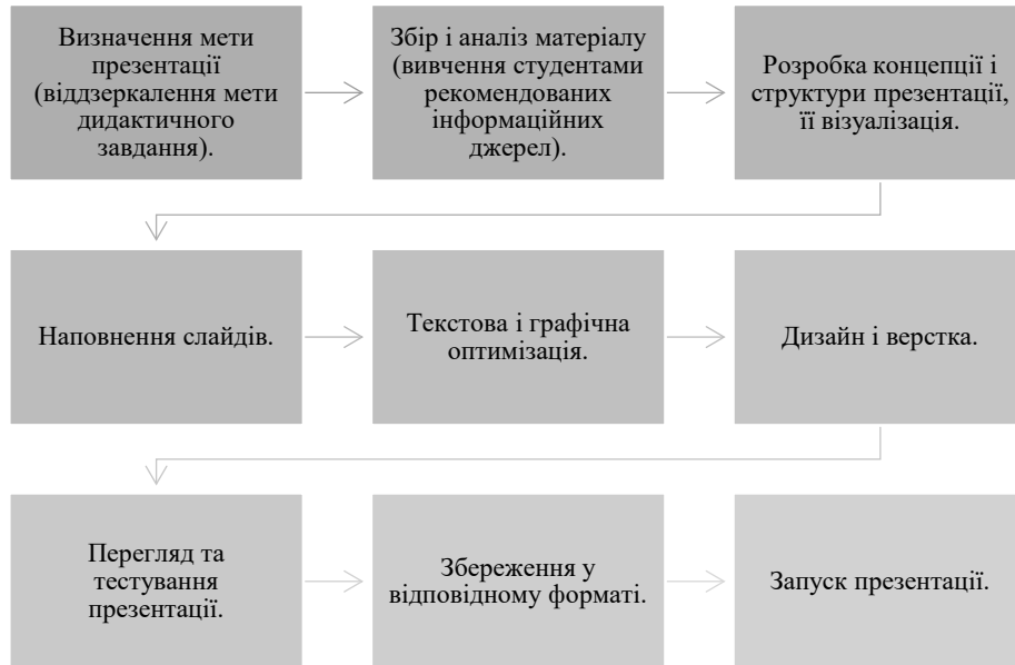
Рис. 3. Алгоритм створення презентації

Для двох основних видів презентацій (презентація як супровід доповіді, презентація-відеокліп), зміст яких відображує результати самостійної роботи студентів-юристів, використовується єдиний алгоритм їх створення (рис. 3):