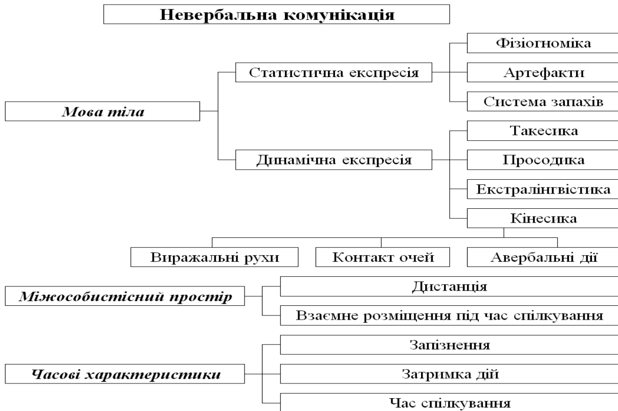
Рис. 1. Компоненти невербальної комунікації

Жестикуляція відбувається на підсвідомому рівні. Жести – це мова емоцій. Вони передують висловлюванням.