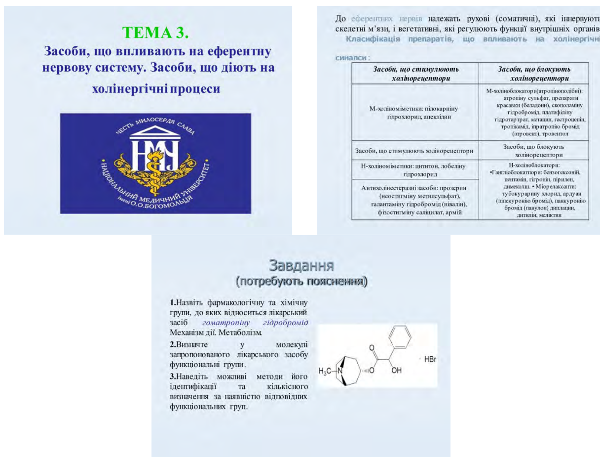
Рис. 1. Вебкейс до теми 3. «Засоби, що впливають на еферентну нервову систему. Засоби, що діють на холінергічні процеси» (ЗМ 3) (авторка-розробниця Бут І.О.).

поділяються на: теоретично-орієнтовані (всього 5); практико-орієнтовані (всього 23); науково-дослідні (всього 2); для виконання самостійної роботи студентів (всього 5). Рис. 1 ілюструє приклад вебкейсу, що розміщено в ЕНК «Фармацевтична хімія» дистанційної платформи LIKAR_NMU НМУ імені О. О. Богомольця.