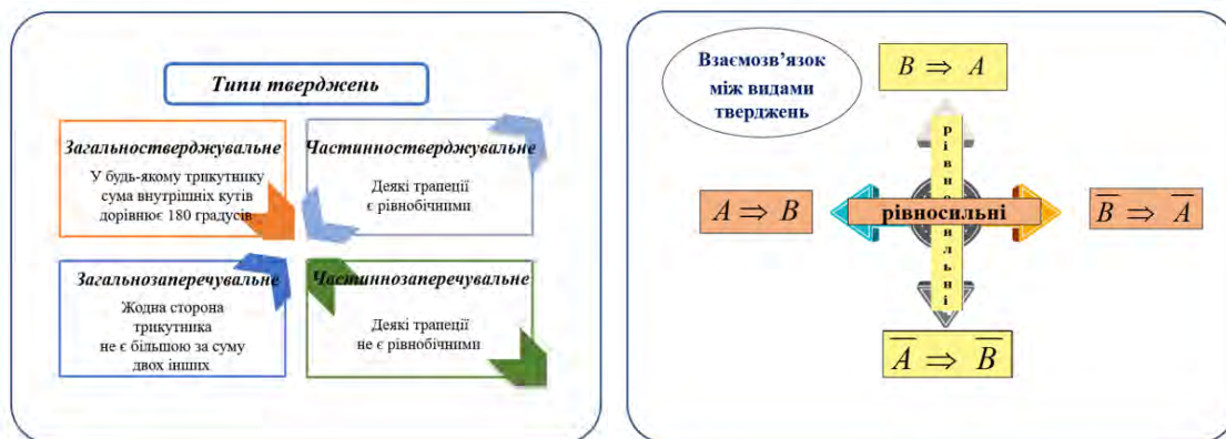
Рис. 3. Цифрова візуалізація навчального контенту з математики в Google Документі

Приклад найпростішої візуалізації в Google Документі зображено на рисунку 3.