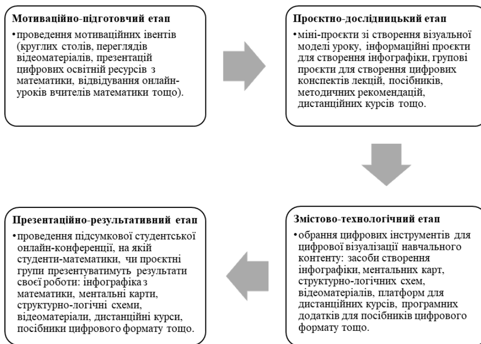
Рис. 1. Технологія цифрової візуалізації навчального контенту у процесі формування цифрової компетентності майбутніх учителів математики

На підставі вивчення праць учених (Л. Білоусова, М. Друшляк, В. Жамардй, Н. Житеньова, О. Ільченко, Н. Кононец, Ю. Лавриш, М. Лещенко, В. Логвіненка, О. Семеніхіна, О. Школа та ін.) визначено етапи технології цифрової візуалізації навчального контенту у процесі формування цифрової компетентності майбутніх учителів математики: мотиваційно-підготовчий, проектно-дослідницький, змістово-технологічний та презентаційно-результативний (рис. 1).