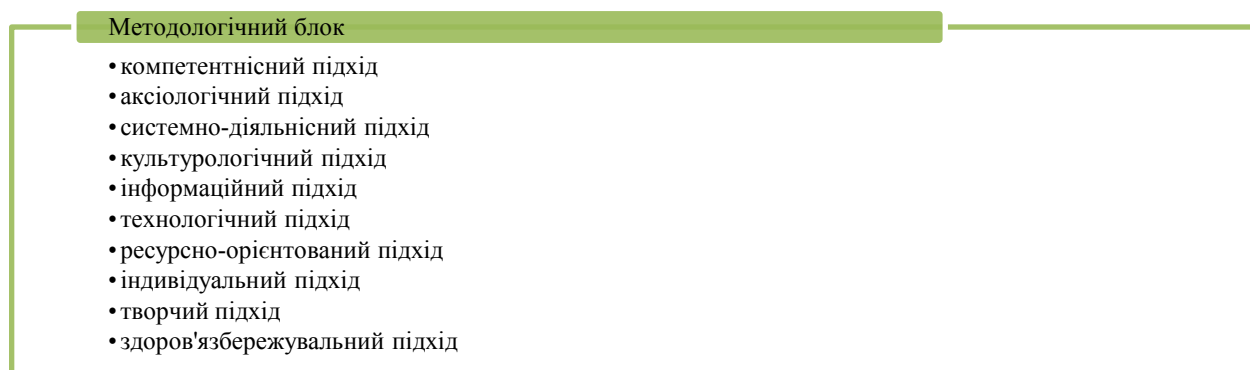
Рис. 3. Методологічний блок дидактичної моделі

Методологічний блок (рис. 3) передбачає реалізацію під час викладання освітнього компонента «Практикум роботи з хореографічним колективом» сукупності методологічних підходів (компетентнісний, аксіологічний, системно-діяльнісний, культурологічний, інформаційний, технологічний, ресурсно-орієнтований, індивідуальний, творчий та здоров'язберезувальний).