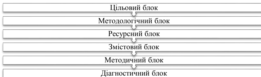
Рис. 1. Блоки дидактичної моделі освітнього компонента «Практикум роботи з хореографічним колективом» у системі підготовки магістрів спеціальності 024 Хореографія

Цільовий блок цієї моделі визначає мету освітнього компонента «Практикум роботи з хореографічним колективом», яка полягає в організації поглибшеного засвоєння магістрантами теоретичних основ хореографічних дисциплін, планування, підготовки та проведення уроків з хореографічного мистецтва, практичної роботи з хореографічним колективом; формування загальних та фахових компетентностей, визначених освітньою програмою та програмою цього освітнього компонента (рис. 2).