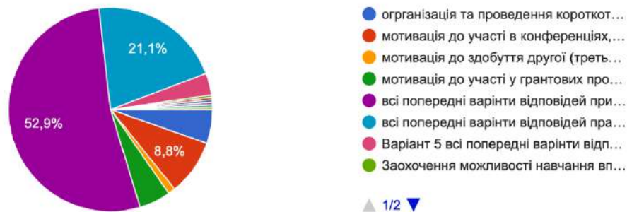
Рис. 2. Результати опитування майбутніх магістрів освітніх, педагогічних наук щодо ролі керівника закладу освіти в професійно-творчому розвитку педагогічних/науково-педагогічних працівників

На запитання «Як Ви оцінюєте підтримку та можливості, що надає Ваш університет для професійно-творчого розвитку студентів?» майбутні магістри всіх закладів вищої освіти загалом відповіли таким чином (у кількісному значенні) (рис. 3):