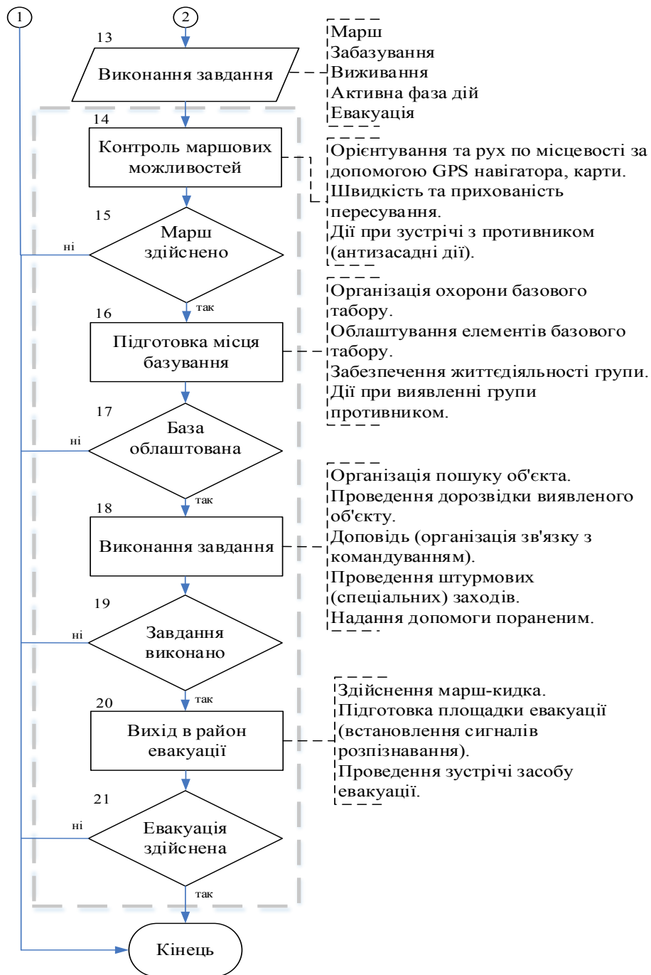
Рис. 1. Методика оцінювання готовності груп спеціального призначення до виконання завдань у відриві від основних сил (ч. 2)

Опис структурної схеми методики оцінювання готовності груп спеціального призначення до виконання завдань у відриві від основних сил. В блоці 1 керівництво групи спеціального призначення отримує бойове розпорядження на виконання завдання в ході вивчення якого встановлюються відомості про противника, вивчається місцевість де буде виконуватись завдання, оцінюються погодні умови на час виконання завдання. Після усвідомлення завдання переходимо до блоку 2 прийняття рішення на виконання завдання, в ході якого розробляється графічна та текстуальна частина рішення з виконання завдання та віддаються попередні розпорядження за напрямками особовому складу групи. після оформлення рішення переходимо до блоку 3 затвердження рішення. В блоці 3 оцінюється повнота відпрацювання текстуальної, графічної частини, а також повнота попередніх розпоряджень. Якщо рішення відпрацьовано в повному обсязі та віддані всі необхідні попередні розпорядження рішення затверджується та здійснюється перехід до блоку 4 постановка завдань групі. В разі необхідності доопрацювання рішення повертаємось до блоку 2 прийняття рішення. В блоці 4 здійснюється віддання бойового наказу та проводиться брифінг з підпорядкованим особовим складом щодо уточнення завдання групи та здійснюється конкретизація дій кожного члена групи, під час віддання бойового наказу та